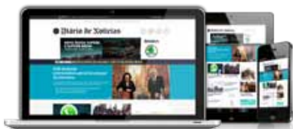
Tabela 17 de publicidade